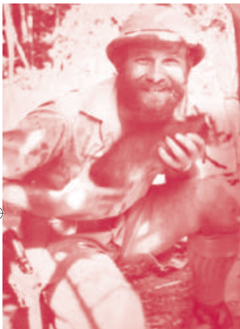
Podczas pobytu w Gujanie