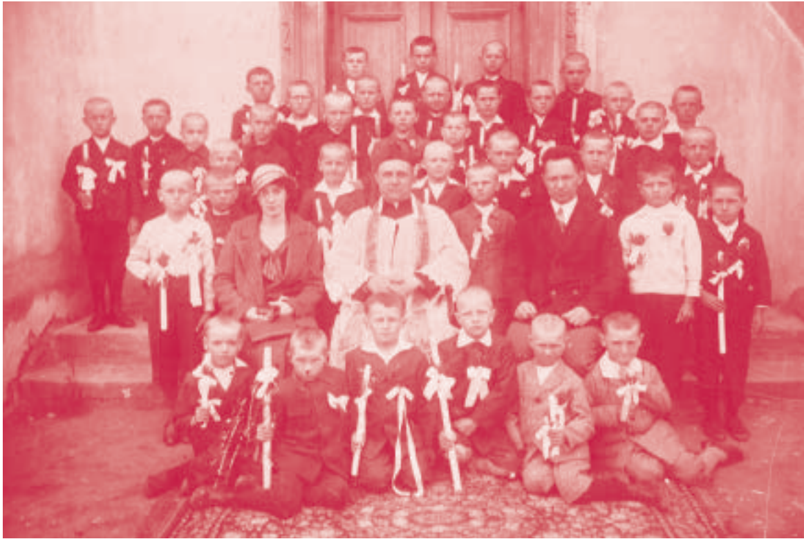
Zdjęcie z I komunii świętej

Za kościołem i na Wygodzie stały radzieckie czołgi. Jak Niemcy w nie uderzyli, to wybiegli z nich popaleni żołnierze. Czołgi ktoś potem rozebrał.