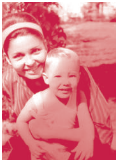
Żona i syn

Podczas swoich licznych wędrówek po świecie, opisywanych w innych publikacjach, autor wiele czasu poświęcał na poszukiwania lokalnych poloników i spotkania z Polakami osiadłymi w różnych częściach świata. Spotkania z Polakami podsumowują te poszukiwania w jednym tomie, dając obraz o Polakach zamieszkających w odległych częściach świata, tak osobach powszechnie znanych, jak i przeciętnych emigrantach” 11 .