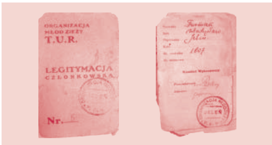
Legitymacja członka OMTUR

Socjalistycznej i Polskiej Partii Robotniczej powstała Polska Zjednoczona Partia Robotnicza (PZPR).