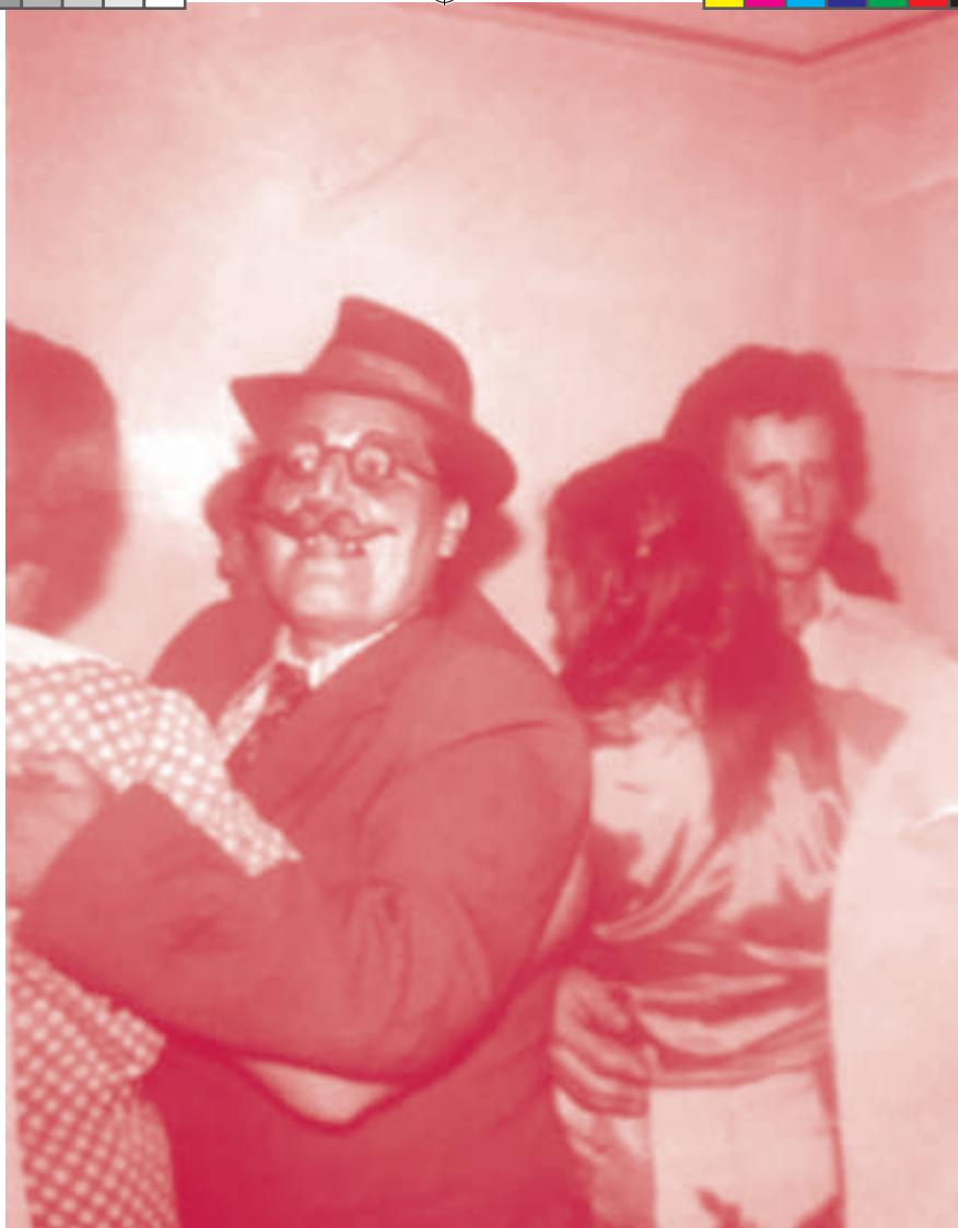
W przebraniu mężczyzny na jeleńskim weselu.

Jej znakami rozpoznawczymi było także duże poczucie humoru i umiłowanie do zabawy. Na jedno z odbywających się w Jeleniu wesel przysła przebrana za mężczyznę i obtańcowywała wszystkie kobiety. Któregoś dnia wraz z sąsiadką przebrały się za czarownice i wpadły, uzbrojone w miotły, na odbywające się w naszym starym domu zimowisko, w którym brały udział dzieci ze szkoły niedzielnej. Było dużo śmiechu, ale przedtem też i płaczu, zanim dzieci zorientowały się, co się dzieje.