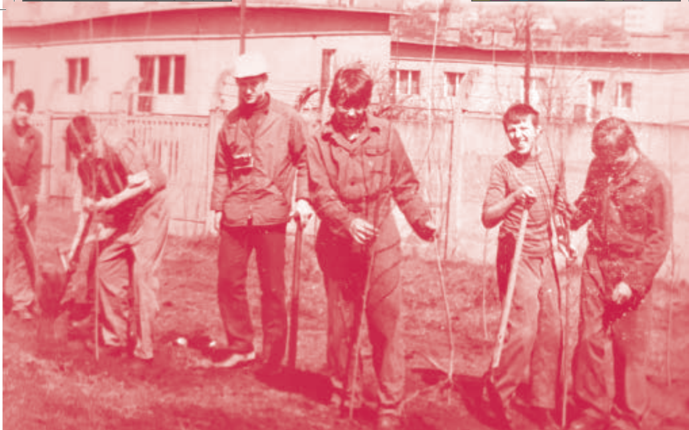
Sadzenie drzew w czynie społecznym

Na Glinnej Górze zasadzono 3.000 brzoź, bębów i modrzewi. A uczniowie zasadniczej szkoły górniczej Kopalni Sobieski zasadzili 3.000 topoli. Drzewa te sadzi się od kilku lat tworząc pas zieleni wokół kopalni”.