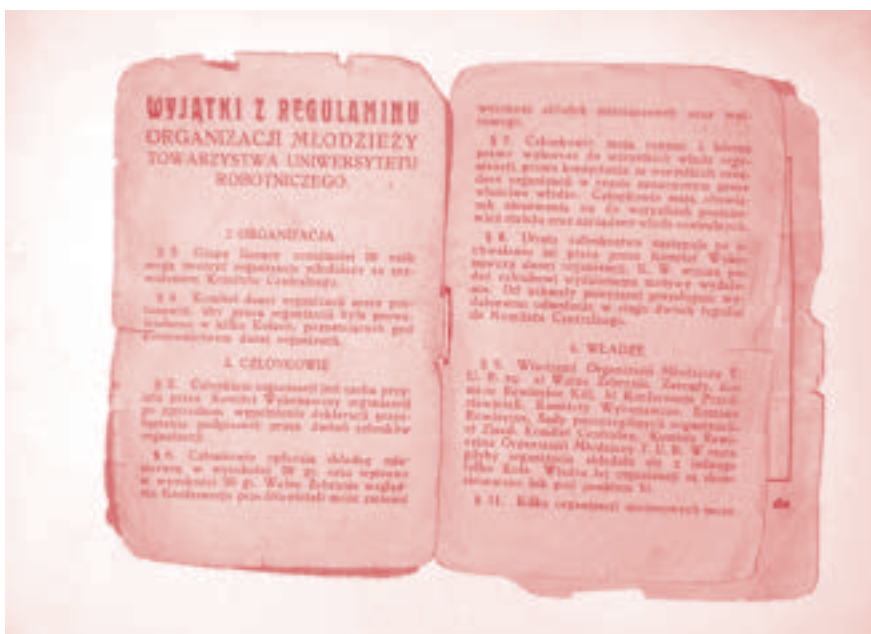
Legitymacja członka OMTUR

Protokoły ze spotkań jeleńskiego oddziału partii PPS pokazują nam, jak wyglądała rzeczywistość tuż po drugiej wojnie światowej i uświadamiają, jak duży wpływ ta partia miała na lokalną społeczność.