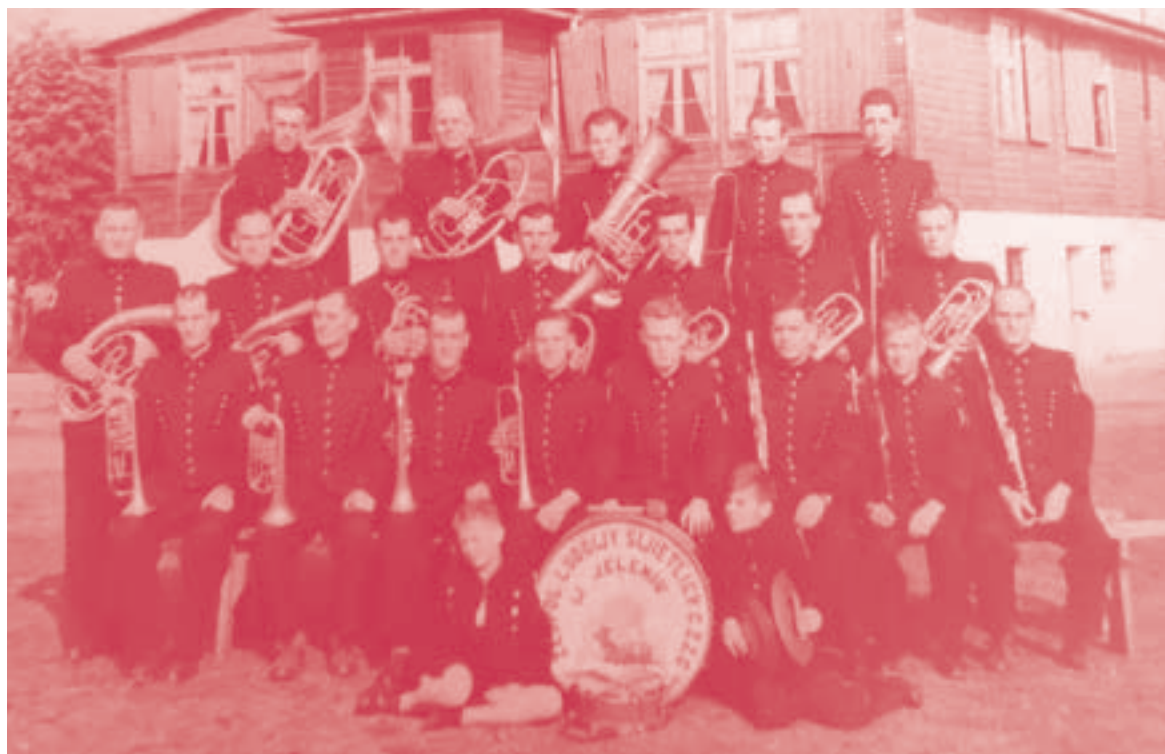
Zespół Ludowy Świetlicy ZZG w Jeleniu, w tle barak