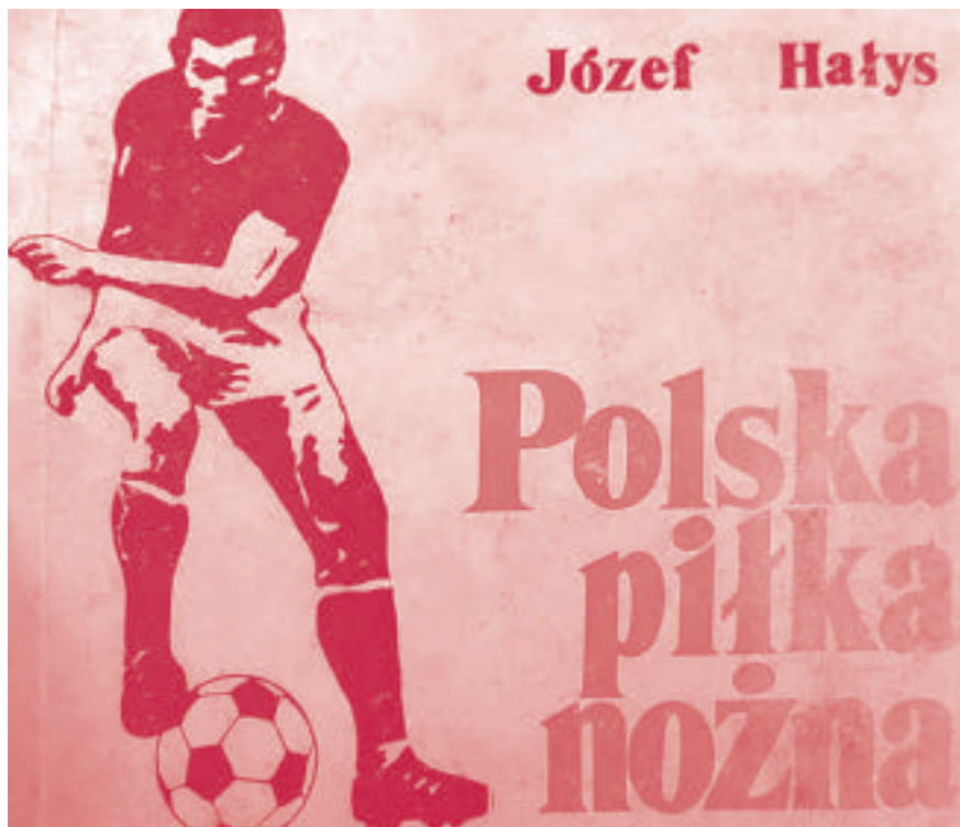
Nagroda w turnieju piłkarskim

dając niejednokrotnie godziwą rozrywkę nie tylko dla kibiców sportowych ks „Górnik” w Jeleniu, ale spełniał rolę wychowawczą dla młodzieży” 4 .