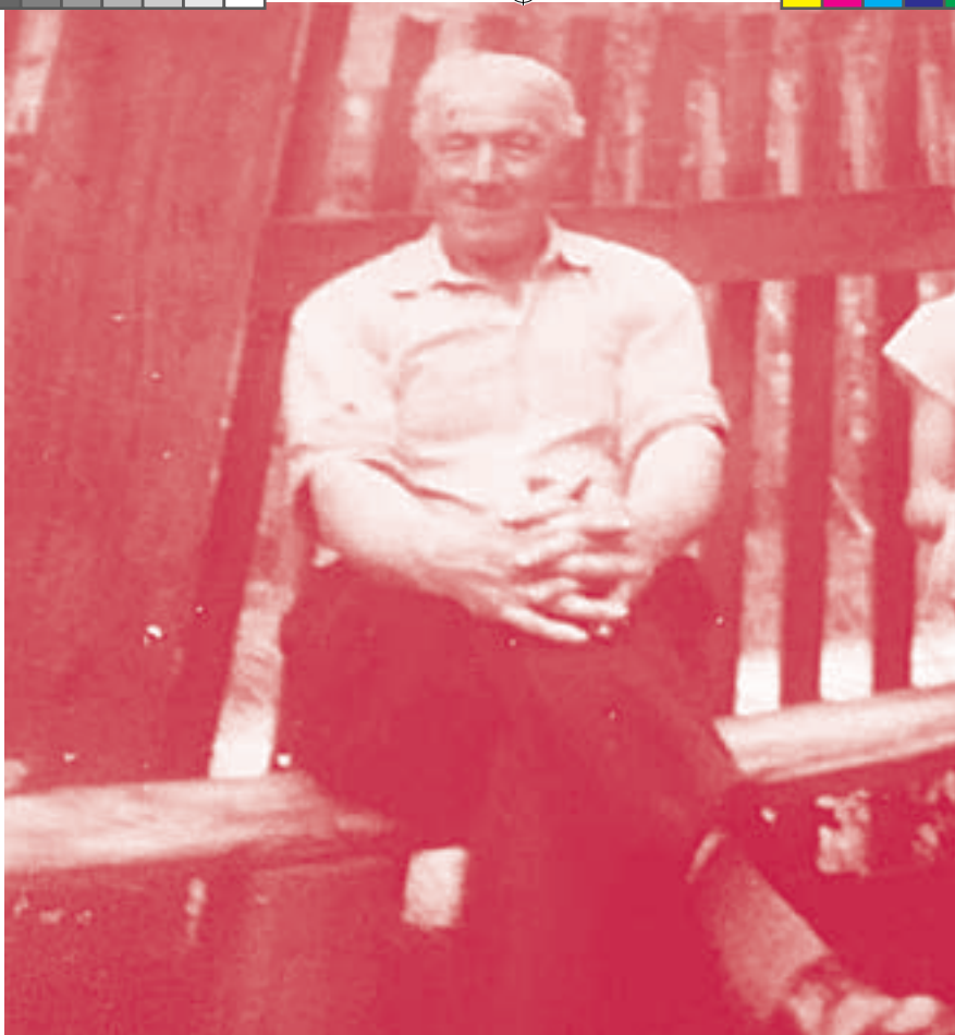
Dziadek na własnoręcznie zrobionej ławeczce