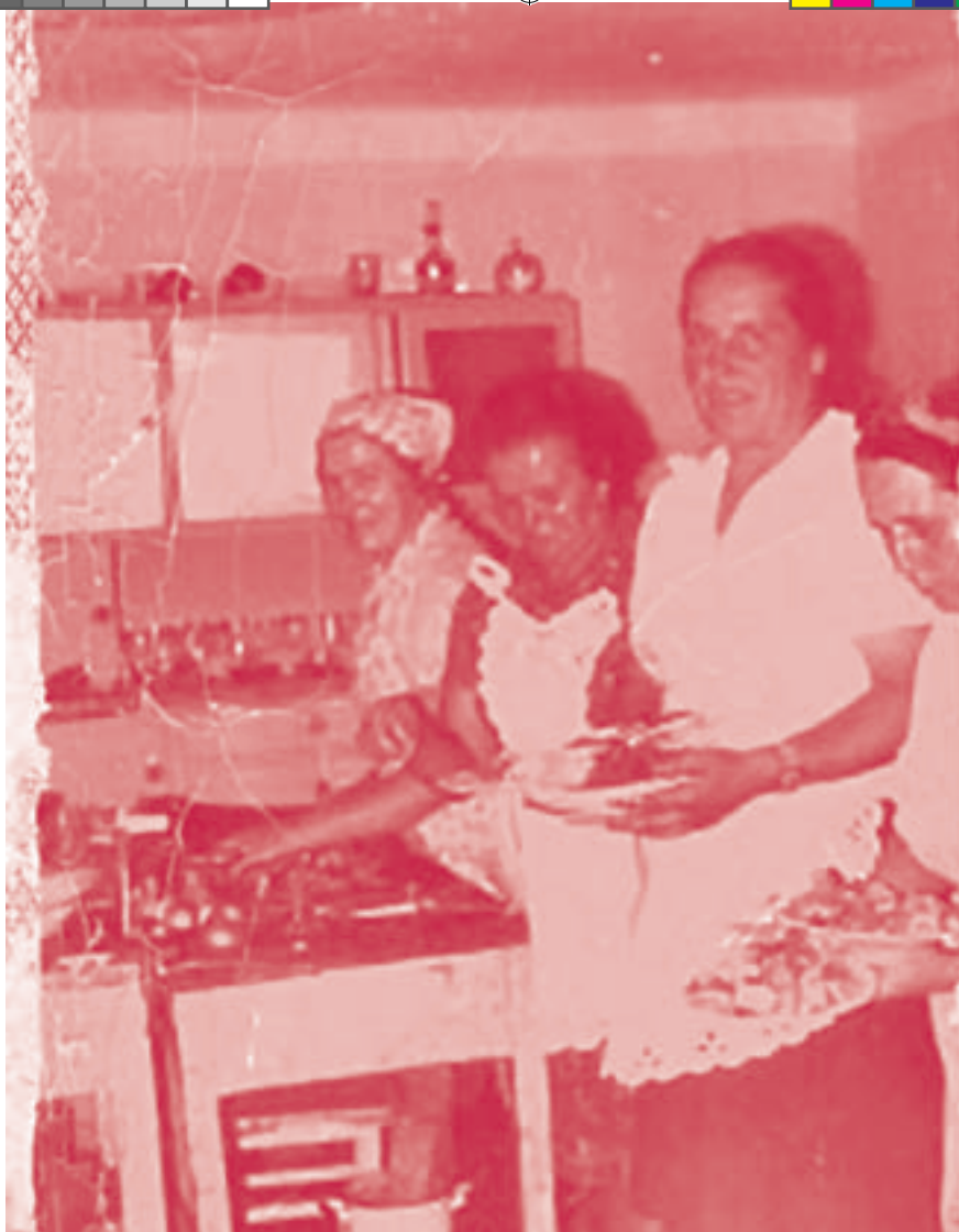
Jako pomocnica na weselu w Jeleniu

Dawniej przed pogrzebem nieboszczyka wystawiało się w domu. Gdy umarł nasz sąsiad, babcia zabrała mnie tam. Pamiętam, że głowę sięgałam nieco powyżej jego ogromnych, jak mi się wtedy wydawało, butów i obserwowałam, czy aby na pewno się nie poruszy. Innym razem poszłam do domu, gdzie w trumnie leżała dziewczynka w sukience komunijnej... A przynajmniej taki obraz mam w pamięci.