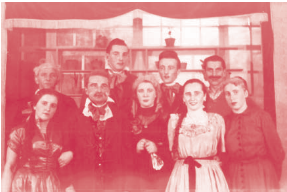
Aktorzy jeleńskiego teatru