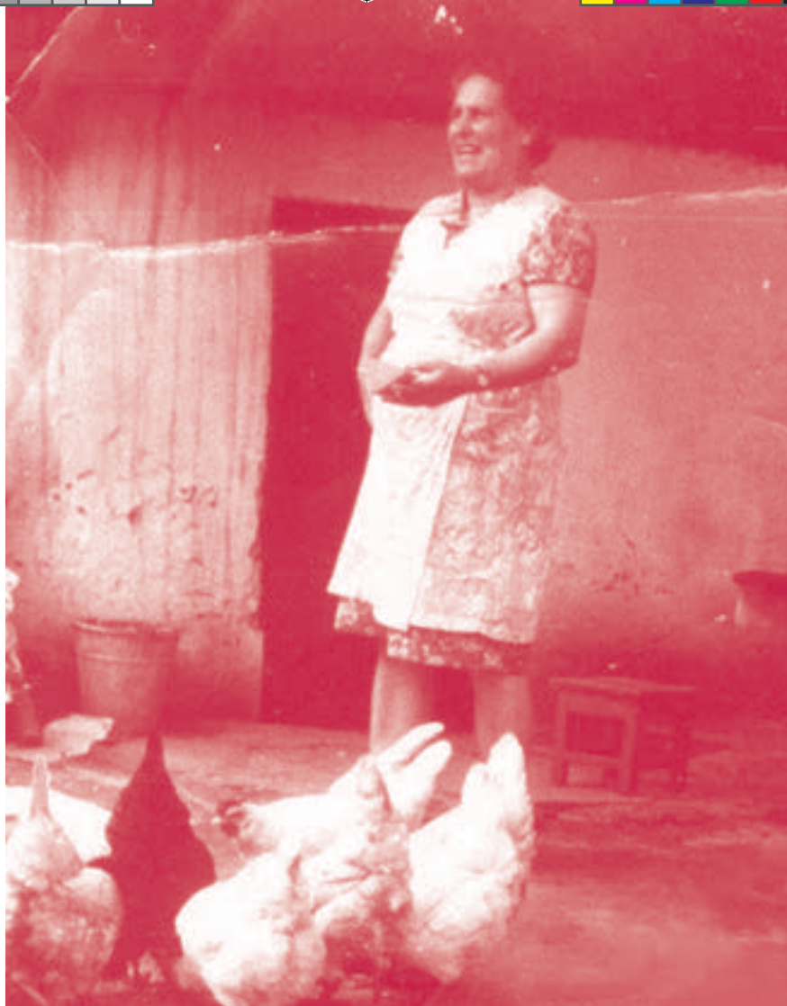
Z babcią przed domem. Lata 70.

się dopiero o czternastej. Stałam tam znudzona przez jakieś pół godziny, a tuż przed czternastą przychodziła babcia i stawiała przede mną w kolejce. Tym sposobem wracałyśmy do domu z dwiema kawami, bo przypadała jedna na głowę. W nagrodę dostawałam paczkę landrynek w kształcie księżyców oraz możliwość uczestniczenia w świętowaniu tego wydarzenia, czyli w organizowanych przez babcię spotkaniach z jej rówieśniczkami przy kawie i ciastku.