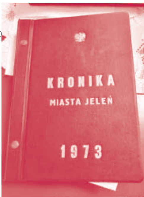
Kronika pozostaje w prywatnych rękach