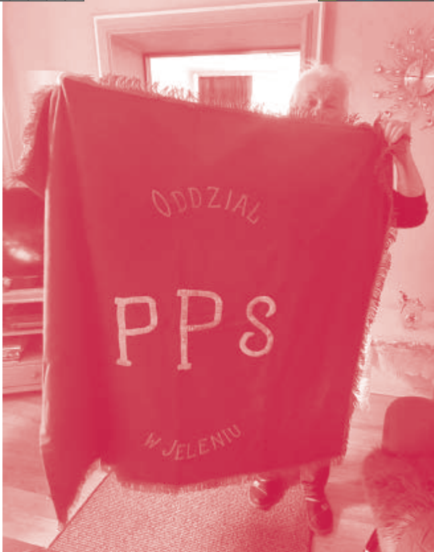
Sztandar PPS obecnie

Do sprawy aparatu filmowego powrócono na drugim styczniowym zebraniu w 1946 roku. W protokole czytamy, że „sprawa oparła się o PUBP 7 w Chrzanowie, gdzie rozstrzygnięto, że aparat będziemy mogli mieć do dyspozycji razem z bratnią partią P.P.R. i Z.W.M 8 ”.